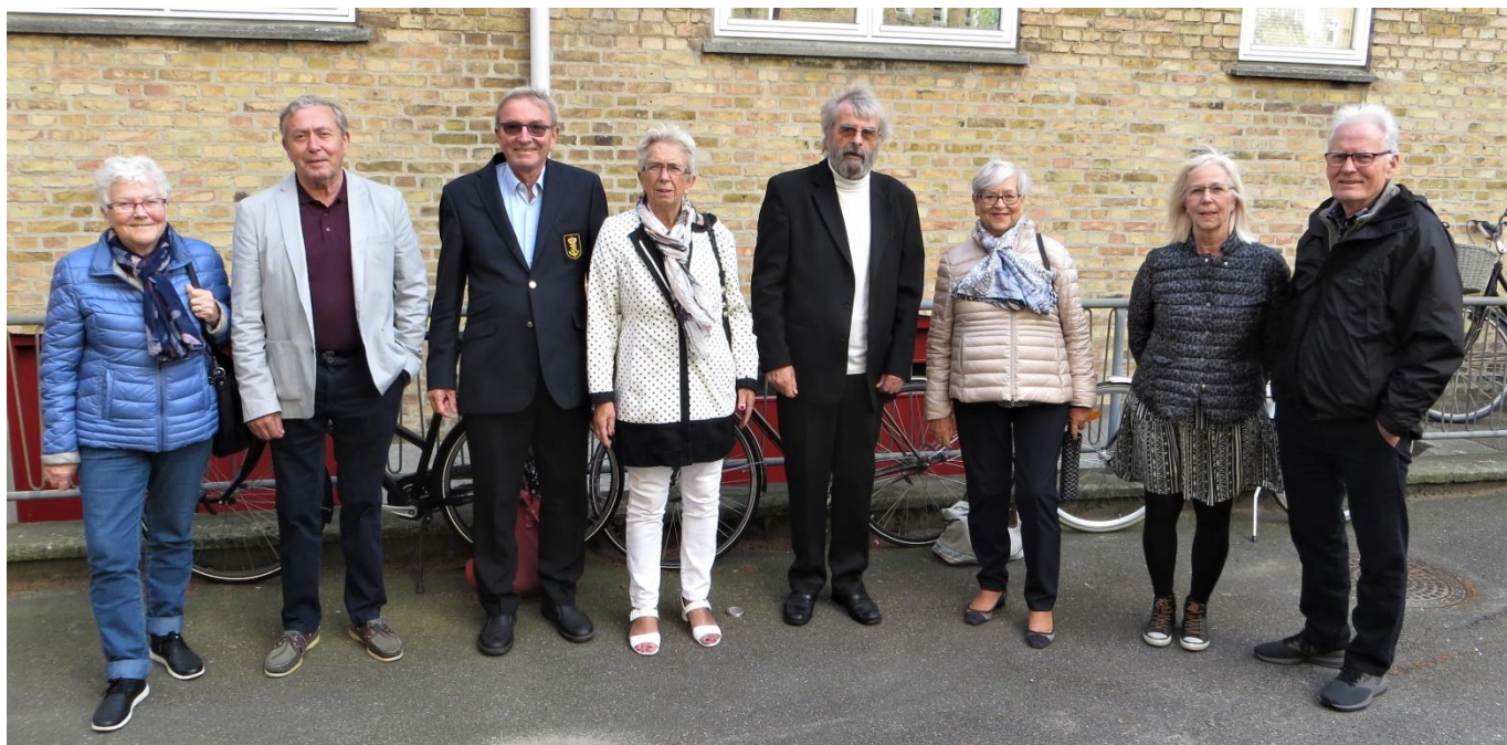
I Treleddets gård 2019

Vi var tilsmilet af pænt vejr, så vi kunne efter frokosten gå gennem den velplejede Lindevangspark til Treleddet, hvor vi efter en rundtur i gården tog opstilling til et gruppefoto.