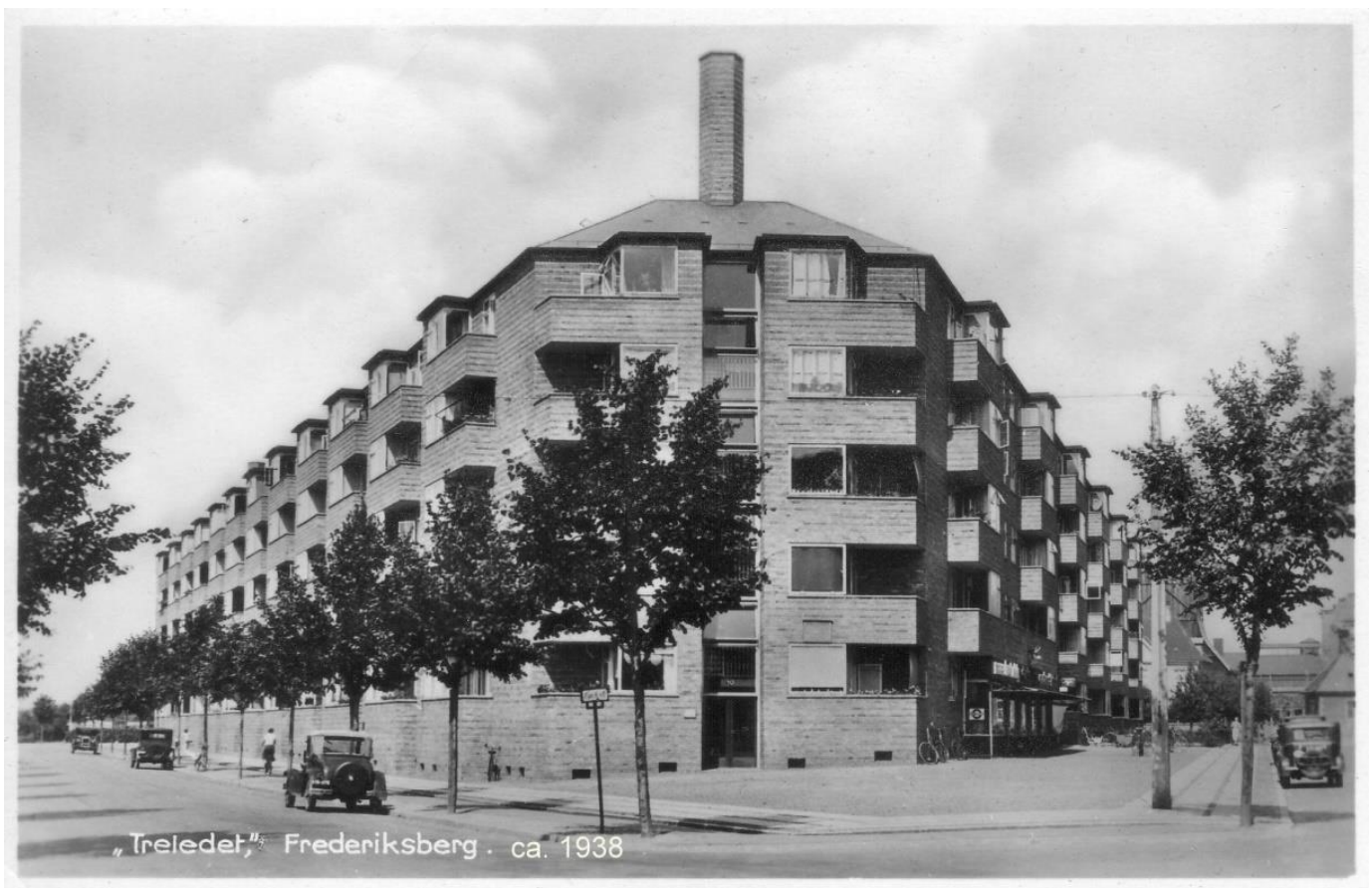
Et tidligt billede fra 1938 af Treledet – bemærk bilerne ! Her ses også én af 3 høje skorstene fra varmecentralerne i ejendommens hjørner.