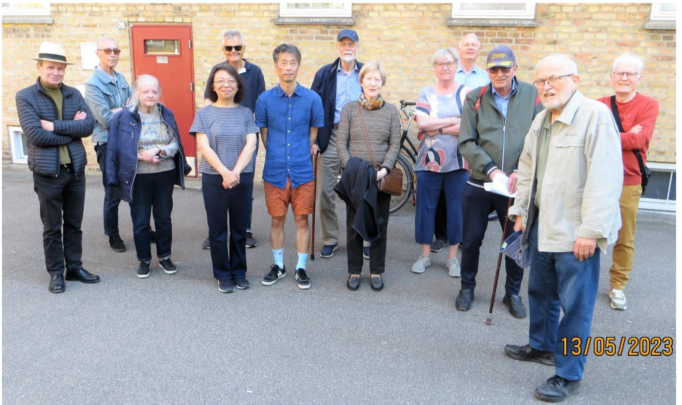
Deltagere i rundvisningen en dejlig solskinsdag i maj 2023.